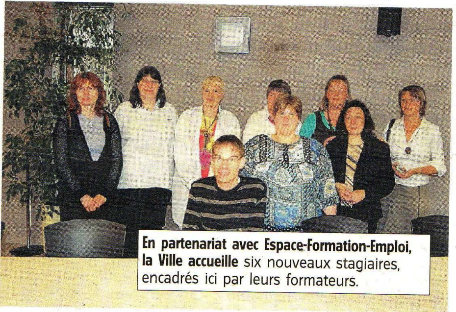
En partenariat avec Espace-Formation-Emploi, la Ville accueille six nouveaux stagiaires, encadrés ici par leurs formateurs.

La Ville poursuit ses innovations en matière d'accueil. Elle vient de concrétiser en CDI l'accueil de 4 personnes handicapées formées grâce à un partenariat.