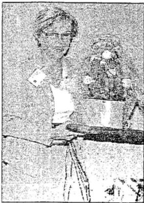
Un beau bouquet de fleurs pour la directrice.